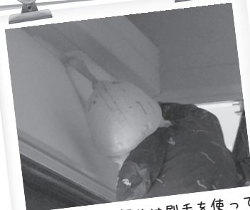
隅や目地の部分は刷毛を使って塗っています