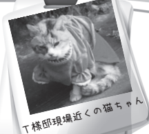
T様邸現場近くの猫ちゃん

T様邸とっても綺麗になったニャ 仕上がりは白石工務店 ホームページにて見れるニャン