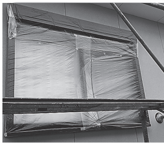
窓など塗料がかからない様に養生をする