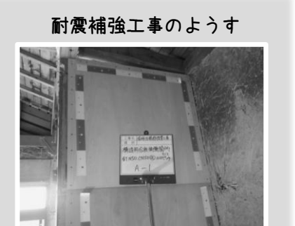
耐震補強工事のようす

リフォームは古くなったお家の健康診断でもあります。 機器を新設するだけでなく、柱の状態なども一緒に確認してみませんか?