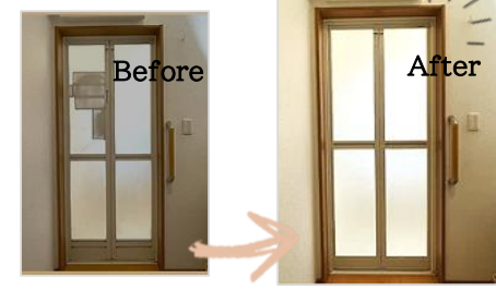
簡単に交換できてすっきり快適。

防犯性の向上に加え、断熱性や通風、採光の問題も解消され悩み解決！！わが家の顔が一新され、玄関の雰囲気明るくなり、防犯対策も強化されます。現在の生活に「快適さと安心」をもたらすのが、リフォーム用玄関ドア「リシエント」です。