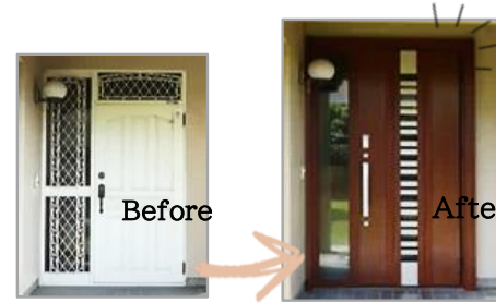
住まいの顔を素敵にリフレッシュ。