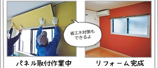
パネル取付作業中

引越し不要で、スピーディな施工 今ある窓・壁・床の上から取り付けるだけで工事完了。